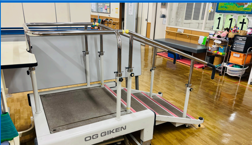
階段昇降で、歩行力の維持・転倒予防